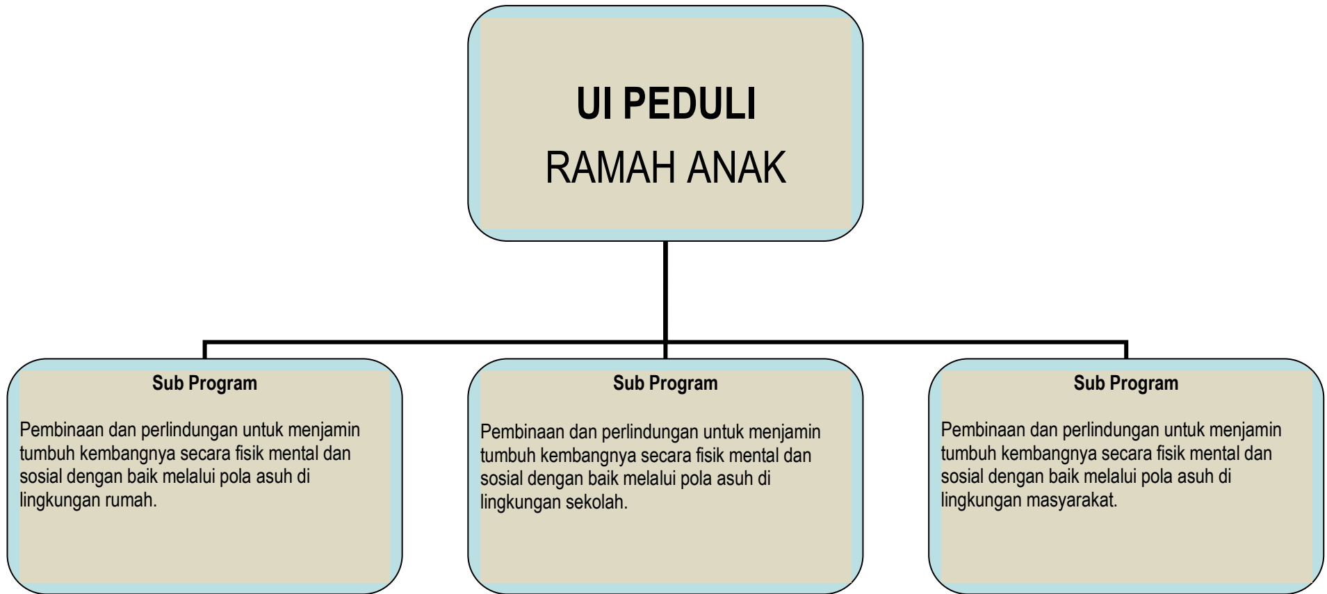
Gambar 2. Rancangan Program UI Peduli Ramah Anak