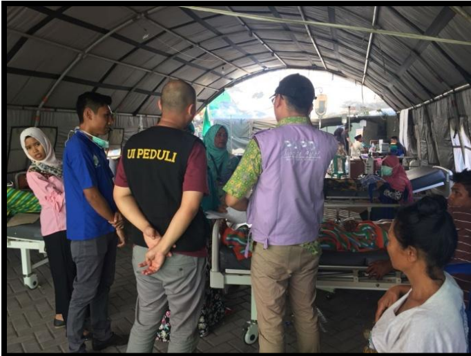
Foto Aksi Tim Medis