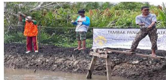
Pemanfaatan "lahan tidur" hutan mangrove milik privat menjadi kawasan wisata.