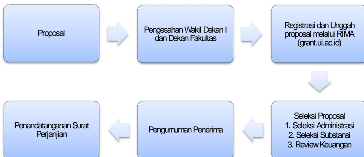
Diagram Alur Pendaftaran dan Seleksi Proposal Hibah Riset UI

Pengiriman dan tahapan seleksi proposal mengikuti diagram alur seperti pada Gambar berikut